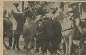
LUCHA RACIAL NA MONTGOMERY

naun traje espacial. E duranan aki - a tur cos busa seque plus - na fin de luna aki lo haci un vuelo den espacio. E p'atenciamto aki a lantá hopi mas e Inocencian na Cape Kennedy